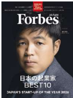
『Forbes JAPAN』2026年1月号 (発行: リンクタイズ株式会社)

Forbes JAPAN誌において、2024年11月から2025年10月の1年間におけるIPOおよびM&Aによるキャピタルゲインをもたらしたキャピタリストのランキング「日本で最も影響力のあるベンチャー投資家ランキング」が実施され、JVCAもこれに協力いたしました。結果として、Forbes JAPAN 2026年1月号 (2025年11月25日発売) 誌上にて、上位10名のキャピタリストのランキングが発表されました。ご協力いただいた会員企業の皆さま、誠にありがとうございました。