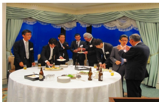
写真：懇親会の様子