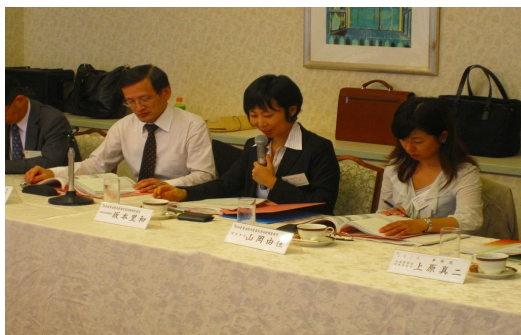
写真：懇談会の様子

その後会場を移動して行いました懇親会でも日頃あまり接点がないVC各社間からの情報交換が出来、共通の課題・問題への意識を高め合うことができました。