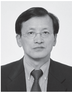
一般社団法人 日本ベンチャーキャピタル協会 会長

投資家の皆様の期待にお応えし、日本経済のさらなる発展に貢献することを使命と考え、従来以上に積極的な取り組みを行って参りますので、一層のご支援・ご鞭撻を賜りますようお願い申し上げます。